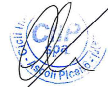
Fig. n. 19